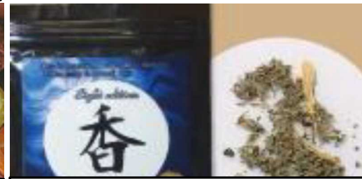
สารออกฤทธิ์ต่อจิตประสาทใหม่ (NPS)