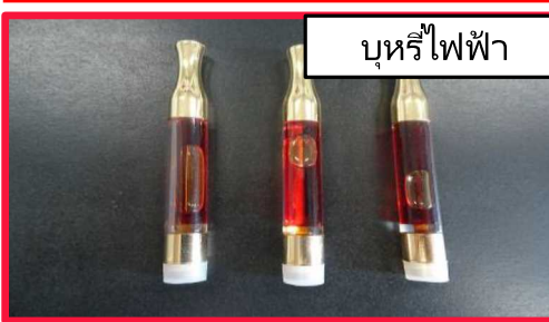
บุหรี่ปั๊พ