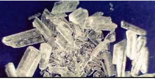
สารกระตุ้นประสาท

* การใช้กัญชาในญี่ปุ่นและการนำเข้าสารออกฤทธิ์ต่อจิตประสาทใหม่ (NPS) ไปยังญี่ปุ่นเป็นสิ่งต้องห้ามตามกฎหมายปัจจุบัน