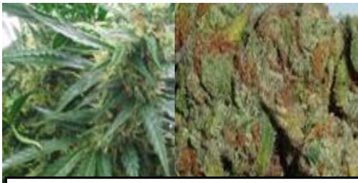
กัญชา, กัญชง