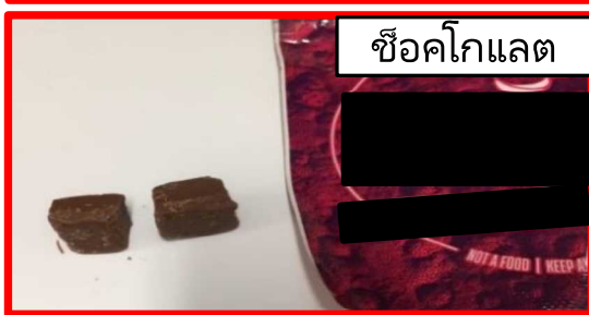
ช็อคโกแลต