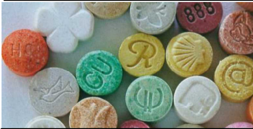
เอ็มดีเอ็มเอ (ยาอี (ecstasy) หรือยาเลิฟ)